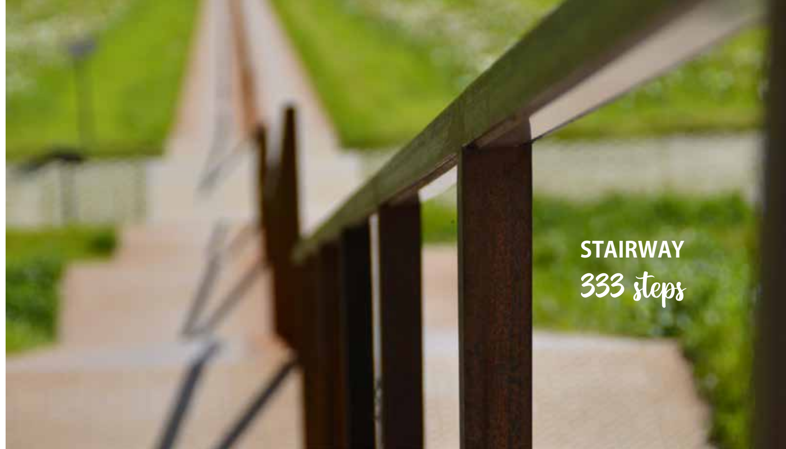
STAIRWAY 333 steps