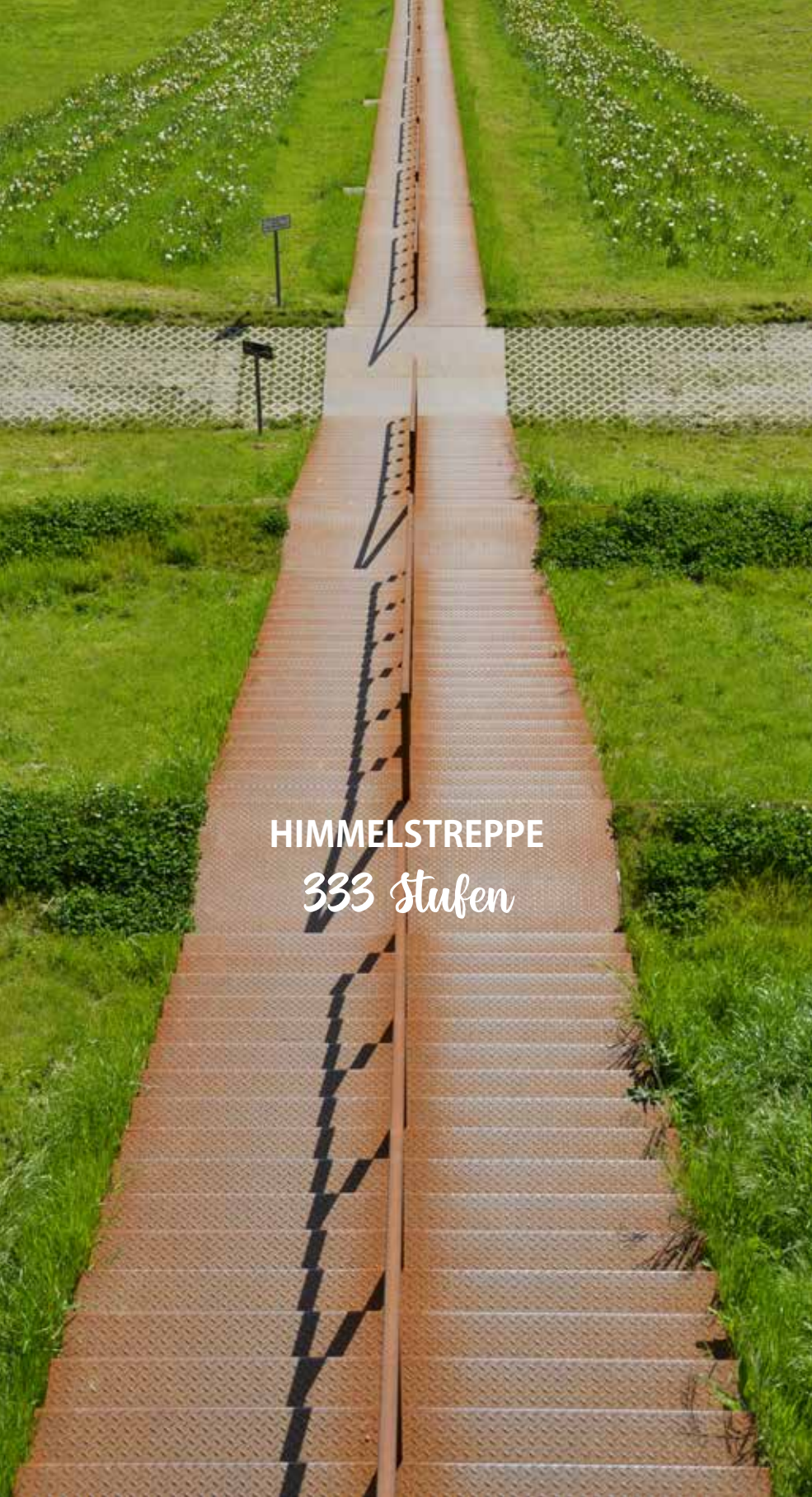
HIMMELSTREPPE 333 Stufen