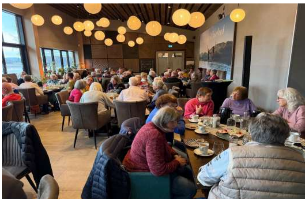
Wie immer gut besucht – Gemeinsam Erleben – Gemeinsam Erleben- im H1 am See

Der Jakobsweg ist einer der beliebtesten Pilgerwege der Welt. Es gibt mehrere Gründe, warum Menschen den Jakobsweg gehen: Sie möchten Gott näher sein, sie möchten einen Sinn im Leben finden, sie möchten etwas Neues erleben oder sie möchten sich einfach frei fühlen. Im Rekordjahr 2025 gingen 530.987 Pilgern diesen Weg.