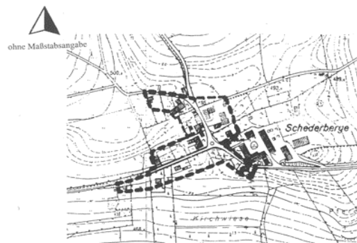
☐ ☐ Räumlicher Geltungsbereich der Außenbereichssatzung für einen Teilbereich des Ortsteiles Schederberge