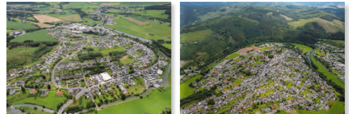
Abb. 47 und 48: Freienohl – Luftbilddarstellungen