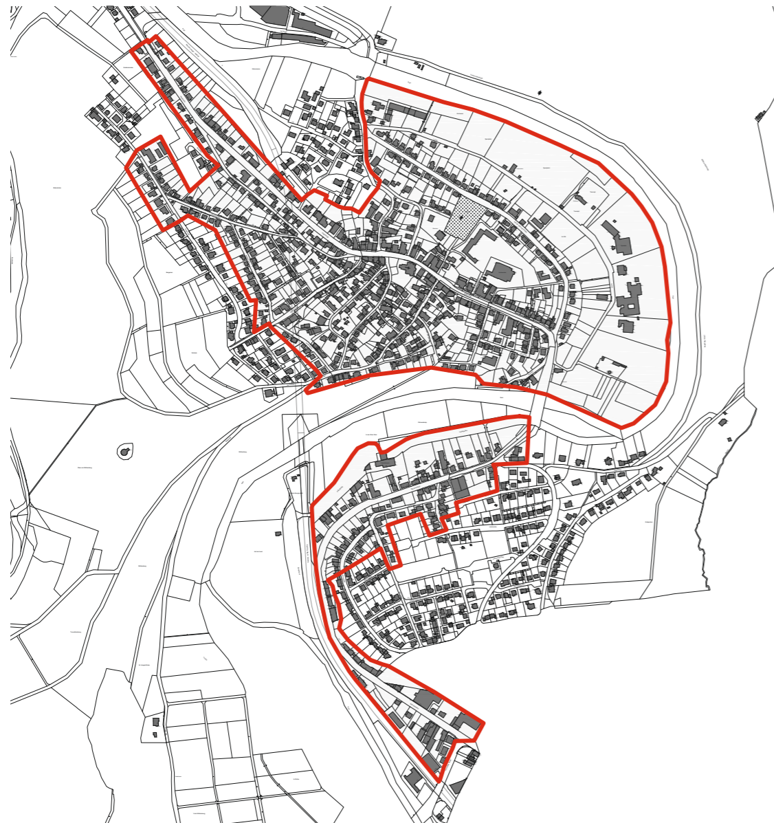
Abb. 51: Abgrenzung des Förderbereichs